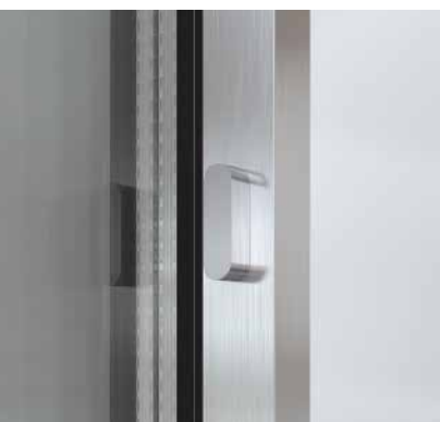
Zentral angebrachtes Schließsystem Locking system mounted centrally

The Schüco ASE 67 PD aluminium sliding system also includes an locking system that is fully integrated in the vent and available in three different versions: as a locking point integrated in the interlock section, with or without a lock, or as a 3-point lock for the outer frame that is inserted in the side of the vent. Its combination furthermore provides a high-quality, burglar resistant unit, ensuring maximum security and the greatest possible protection.