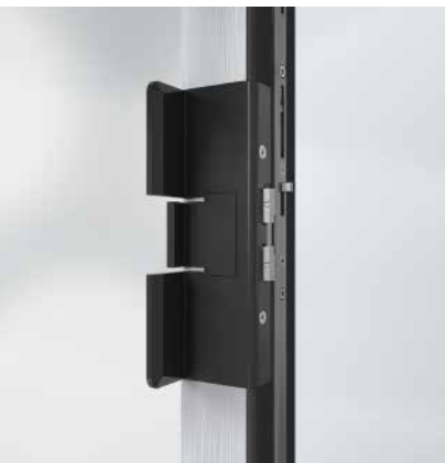
Seitlich integriertes Schließsystem Locking system integrated at the side

Both the narrow profiles and the insertion of the vent profile in the outer frame increase the proportion of window area. This allows more natural light into the room, which not only contributes to improving the physical and mental wellbeing of the user, it also saves energy in the long term.