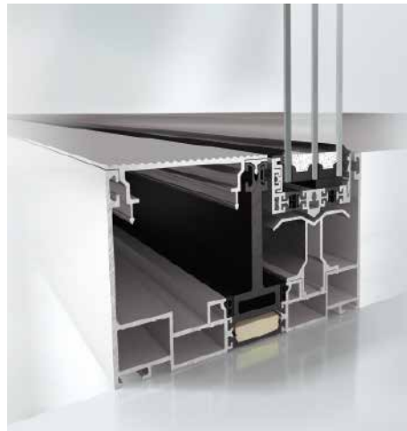
Abgesenktes Flügelprofil im 90-mm-Blendrahmen Lowered vent profile in the 90 mm outer frame